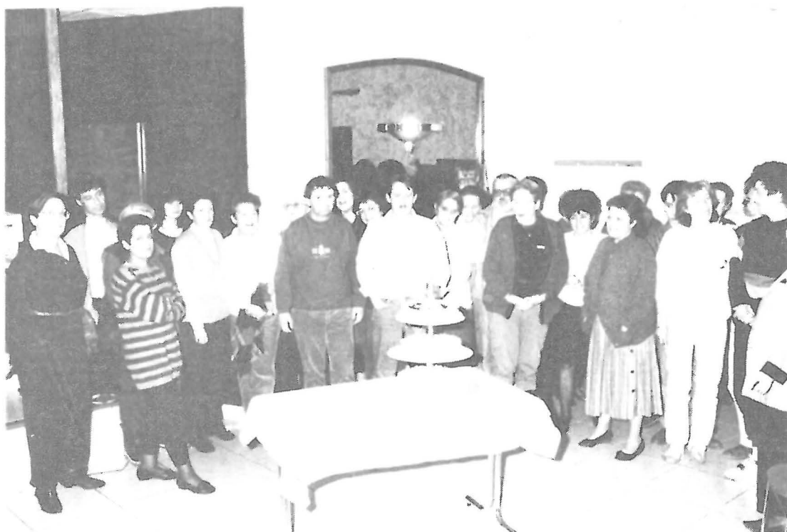
LA 2 5 ème HEURE : LES PAUPIERES SONT LOURDES POUR LES 42 ACTEURS DE CE MARATHON, ENCORE UN PETIT EFFORT POUR DEGUSTER UNE PART DE GATEAU, ET CHACUN POURRA PRENDRE UN PEU (OU BEAUCOUP) DE REPOS BIEN MERITE.